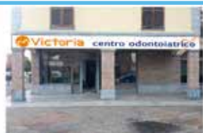
Corso Martini, 30/A - Castelfranco Emilia (MO)