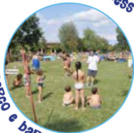
Park e bar estivo