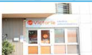
Via B.Paganelli,4 - Modena